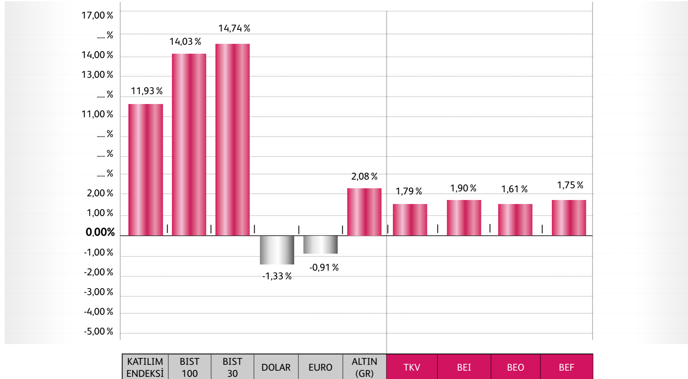
YÜZDESEL GETİRİ GRAFİKLERİ (31 Ocak) Bereket Emeklilik ve Hayat A.Ş. Emeklilik Yatırım Fonları